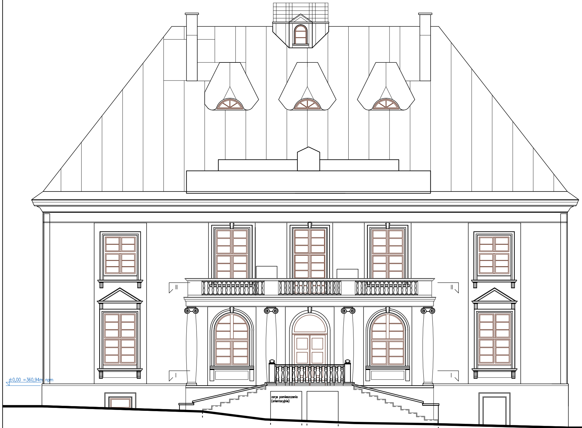
ELEWACJA POŁUDNIOWA – PRZEKRÓJ IN G–G – INWENTARYZACJA