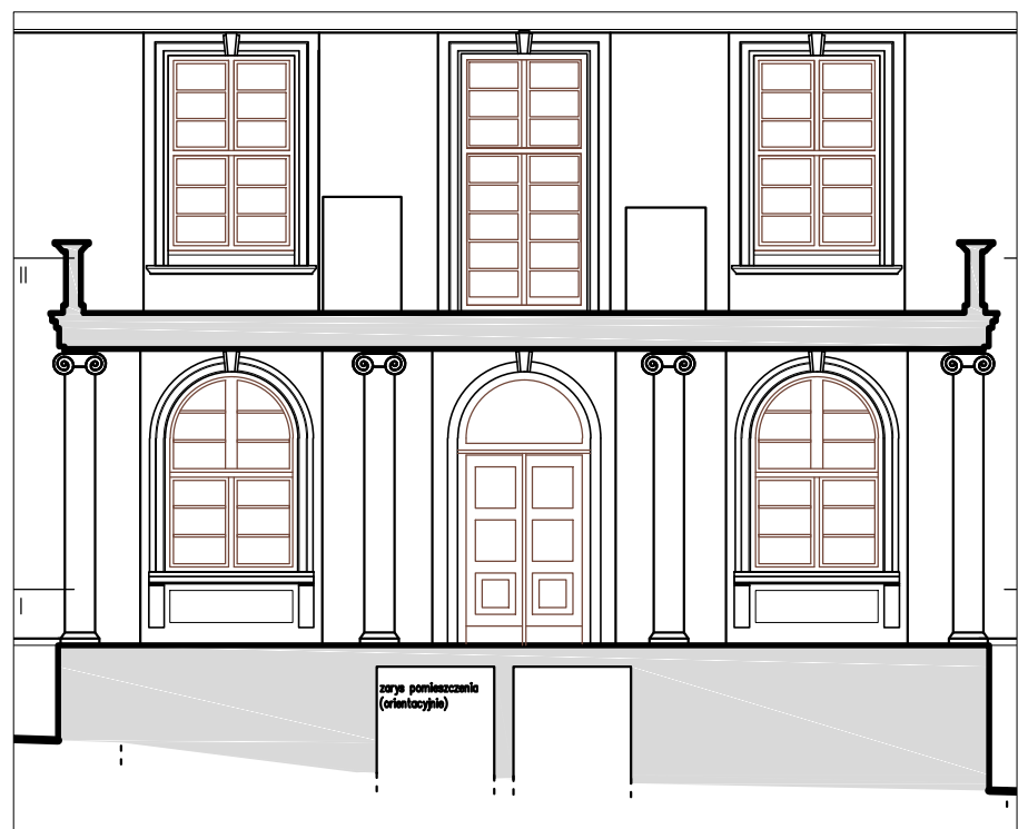
PRZEKRÓJ IN E–E