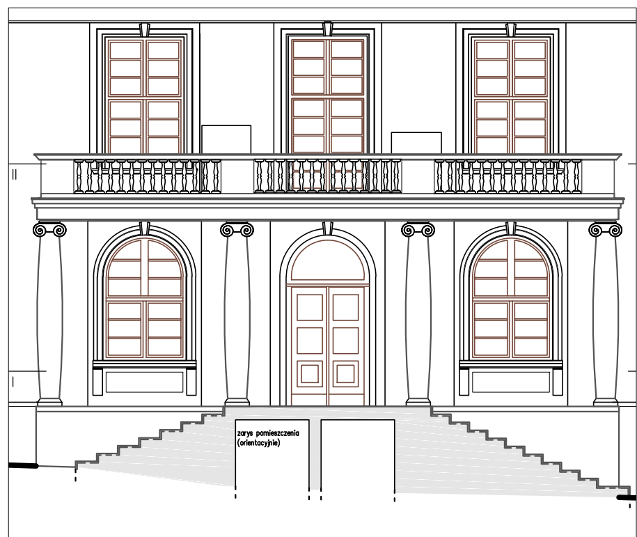
PRZEKRÓJ IN F–F